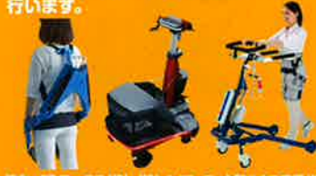
協力: RTワークス(株)、(株)イノフィス、大和ハウス工業(株)、富士ソフト(株)

介護者の身体的負担を軽減するロボット、歩行などの日常生活をアシストするロボット、介護予防に役立つコミュニケーションロボットなどの展示・実演を行います。