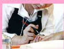
協力/専門学校六歌ビューティカレッジ