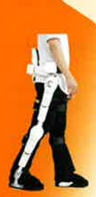
介護ロボット展に 展示しています。

2015年 とき 10月12日 (月・祝) 12:00~17:00 ところ サンメッセ香川 大展示場 [香川県高松市林町2217-1]